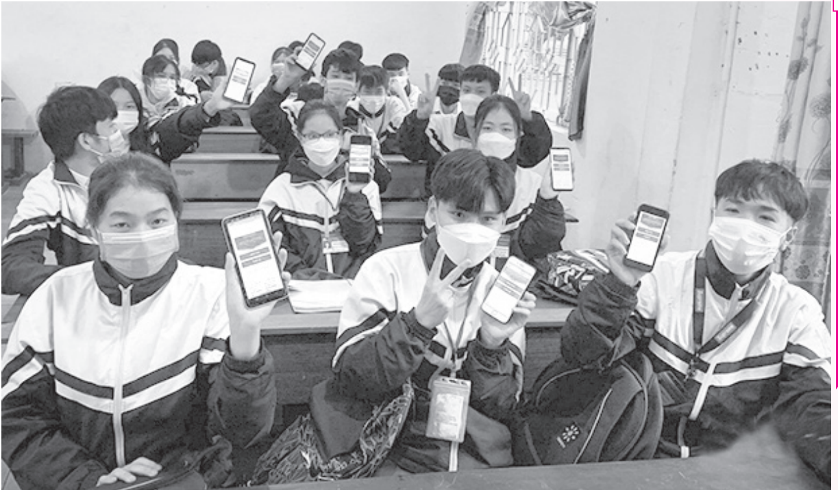
Trường THPT Nguyễn Văn Trỗi (Lộc Hà) tham gia cuộc thi

trường xây dựng chương trình Pháp luật và Đời sống với nội dung giới thiệu quy định pháp luật về buôn lậu, gian lận thương mại và hàng giả, hàng nhái. Bên cạnh đó, trên cơ sở Quy chế phối hợp đã ký kết, Cục QLTT và Sở Tư pháp đã nhiều lần trao đổi các vấn đề vướng mắc trong xử lý vi phạm hành chính, cùng bàn bạc, thống nhất phương án tham mưu UBND tỉnh xử lý nhiều vụ việc vi phạm thuộc thẩm quyền.