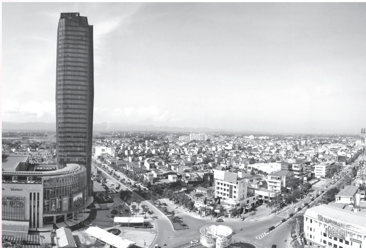
TP Hà Tĩnh ngày càng hiện đại, văn minh

Ôn lại chặng đường 65 năm Hà Tĩnh làm theo lời Bác dạy, 15 năm xây dựng và phát triển của thành phố Hà Tĩnh và tuyên truyền các giải pháp để đưa tỉnh Hà Tĩnh, thành phố Hà Tĩnh phát triển nhanh và bền vững. Tổ chức các hoạt động giáo dục truyền thống nhân dịp kỷ niệm 65 năm Ngày Bác Hồ về thăm Hà Tĩnh, 15 năm thành lập thành phố Hà Tĩnh gắn với các cuộc vận động và các phong trào thi đua của các địa phương, đơn vị trong toàn tỉnh; tổ chức các hoạt động giáo dục truyền thống cho các