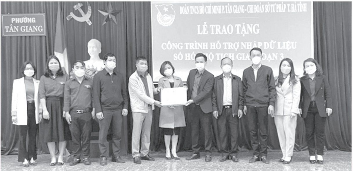
Trao tặng công trình số hóa Sổ hộ tịch giai đoạn 3

quan và doanh nghiệp tỉnh tổ chức, góp phần tuyên truyền, vận động, khuyến khích Đoàn viên, thanh niên tham gia các hoạt động thể dục, thể thao phù hợp như đi bộ/chạy bộ mỗi ngày để tăng cường rèn luyện sức khỏe, nâng cao chất lượng cuộc sống.