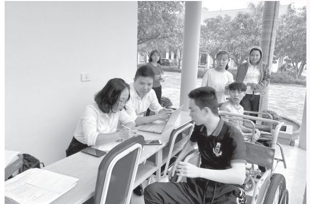
Trợ giúp viên pháp lý của Trung tâm Trợ giúp pháp lý Nhà nước tỉnh Hà Tĩnh đang thực hiện tư vấn, hướng dẫn pháp luật

nước tỉnh Hà Tĩnh phối hợp với Phòng Tư pháp thị xã Hồng Lĩnh tổ chức thực hiện truyền thông về trợ giúp pháp lý và tư vấn pháp luật cho người dân và Người khuyết tật tại 6/6 xã, phường của thị xã Hồng Lĩnh.