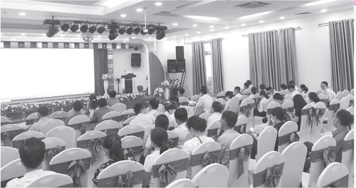
Đoàn viên công đoàn ngành Công Thương Hà Tĩnh được tập huấn về kỹ năng công đoàn tham gia đối thoại tại nơi làm việc, m

TULĐTT đến thời điểm này lên 381 đơn vị, đạt 95% tổng số doanh nghiệp trên địa bàn.