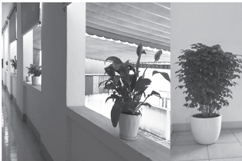
Công trình thanh niên trồng hoa, cây xanh trong khuôn viên Sở

Tiếp đến, Chi đoàn tổ chức cho các Đoàn viên ra quân đồng loạt vệ sinh môi trường trong và ngoài đơn vị nhằm hưởng ứng ngày chủ nhật xanh. Hoạt động đã diễn ra sôi nổi, tạo sự lan tỏa, khơi dậy tinh thần đoàn kết, nhiệt huyết của tuổi trẻ; qua đó góp phần tạo môi trường xanh, sạch, đẹp.