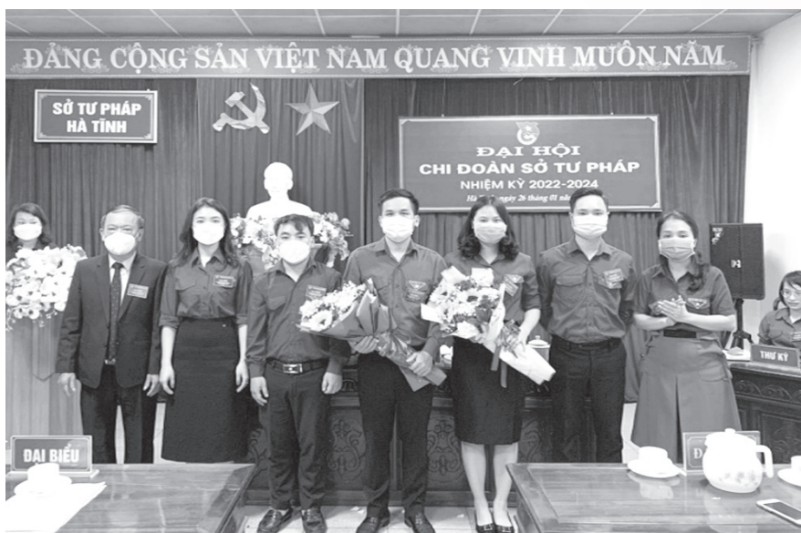
Đại hội Chi đoàn nhiệm kỳ 2022-2024

N gay sau thành công Đại hội, Chi đoàn Sở Tư pháp đã tổ chức cho các Đoàn viên thực hiện công trình thanh niên trồng hoa, cây xanh trong khuôn viên Sở. Đây vừa là công trình thiết thực, ý nghĩa chào mừng kỷ niệm 91 năm ngày thành lập Đoàn TNCS Hồ Chí Minh, Đại hội Đoàn các cấp vừa tạo không gian thoáng mát, thân thiện, góp phần nâng cao hiệu quả công việc.