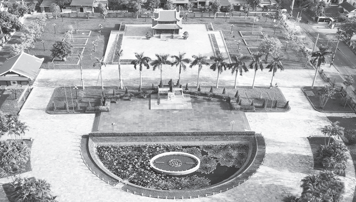
Khuôn viên Khu lưu niệm Bác Hồ về thăm Hà Tĩnh ở TP Hà Tĩnh