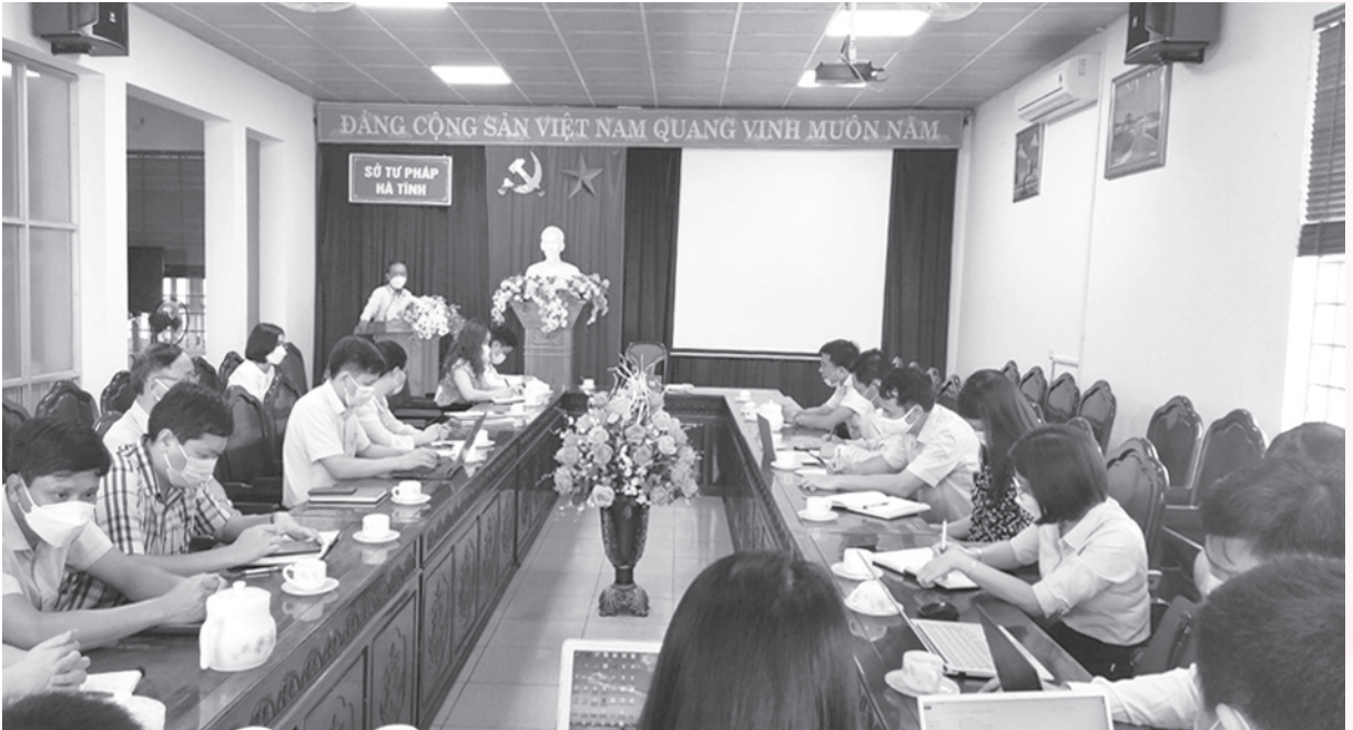
Toàn cảnh hội nghị triển khai dịch vụ công chứng thực bản sao điện tử từ bản chính

N gày 06/01/2022, Thủ tướng Chính phủ đã ban hành Quyết định số 06/QĐ-TTg phê duyệt “Đề án phát triển ứng dụng dữ liệu về dân cư, định danh và xác thực điện tử phục vụ chuyển đổi số quốc gia giai đoạn 2022 - 2025, tầm nhìn đến năm 2030” (gọi tắt là Đề án 06). Đề án được ban hành với mục tiêu chính là ứng dụng Cơ sở dữ liệu quốc gia về dân cư, hệ thống định danh và xác thực điện tử, thẻ Căn cước công dân gắn chip điện tử trong công cuộc chuyển đổi số quốc gia một cách linh hoạt, sáng tạo để phục vụ 5 nhóm tiện ích như sau: (1) Phục vụ giải quyết thủ tục hành chính và cung cấp dịch vụ công trực tuyến; (2) Phục vụ phát triển kinh tế, xã hội; (3) Phục vụ công dân số; (4) Hoàn thiện hệ sinh thái phục vụ kết nối, khai thác, bổ sung làm giàu dữ liệu dân cư; (5) Phục vụ chỉ đạo,