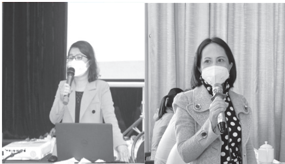
Các đồng chí báo cáo viên phổ biến quy định về xã đạt chuẩn tiếp cận pháp luật.

dựng xã, phường, thị trấn đạt chuẩn tiếp cận pháp luật và Thông tư số 09/2021/TT-BTP ngày 15/11/2021 của Bộ Tư Pháp quy định về nội dung, điểm số và cách tính điểm của các tiêu chí, chỉ tiêu xã, phường, thị trấn đạt chuẩn tiếp cận pháp luật, trong đó, nhấn mạnh các nội dung về: mục đích, ý nghĩa, vị trí, vai trò của xây dựng xã, phường, thị trấn đạt chuẩn tiếp cận pháp luật; các tiêu chí, chỉ tiêu tiếp cận pháp luật; đánh giá, công nhận xã, phường, thị trấn đạt chuẩn tiếp cận pháp luật; quy trình, biểu mẫu, tài liệu phục vụ việc đánh giá, công nhận xã, phường, thị trấn đạt chuẩn tiếp cận pháp luật; thành phần, nhiệm vụ, quyền hạn của Hội đồng đánh giá chuẩn tiếp cận pháp luật... Hội nghị cũng dành thời gian để hướng dẫn, giải đáp những khó khăn, vướng mắc trong quá trình thực hiện xây dựng cấp xã đạt chuẩn tiếp cận pháp luật ở địa phương.