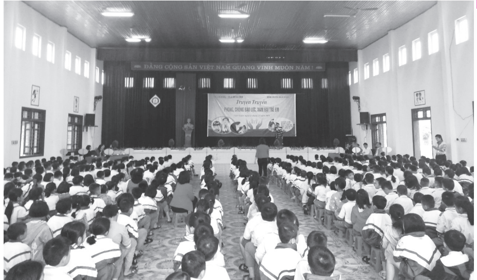
Sở LĐTB-XH phối hợp với UBND huyện Nghi Xuân tổ chức truyền thông về phòng, chống bạo lực, xâm hại cho trẻ em, học sinh.