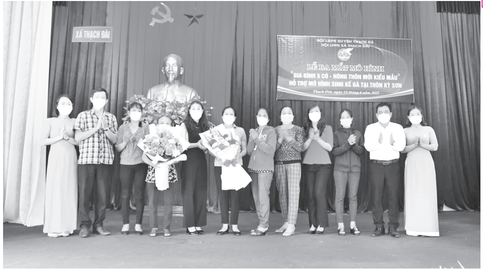
Lễ ra mắt mô hình Gia đình 5 cỏ - Nông thôn mới kiểu mẫu

Ba là , đảm bảo việc lấy ý kiến đánh giá về hiệu quả của mô hình đã xây dựng. Theo quy định hiện nay, hình thức, mô hình thông tin, PBGDPL phải được 80% trở lên ý kiến của đại diện Ủy ban Mặt trận Tổ quốc Việt Nam cấp xã, các tổ chức chính trị - xã hội cấp xã, đại diện các thôn, tổ dân phố xác nhận mô hình đó hiệu quả. Việc lấy kiến được thực hiện qua Phiếu lấy ý kiến theo mẫu ban hành kèm theo Thông tư số 09/2021/TT-BTP của Bộ Tư pháp. Trên cơ sở kết quả đánh giá của các thành viên được