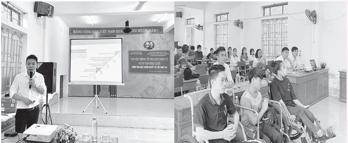
Truyền thông về trợ giúp pháp lý và hưởng ứng ngày khuyết tật Việt Nam (18/4)

Từ năm 2020 đến nay, Trung tâm đã thụ lý, thực hiện 820 vụ việc, trong đó 39 vụ việc cho người khuyết tật có khó khăn về tài chính (chiếm 4,8% tổng số vụ việc). Cụ thể: Tham gia tố tụng 28 vụ việc (lĩnh vực hình sự: 23 vụ việc, lĩnh vực dân sự: 05 vụ việc); tư vấn, hướng dẫn 11 vụ việc (lĩnh vực dân sự: 04 vụ việc, lĩnh vực hành chính: 01 vụ việc, lĩnh vực khác: 06 vụ việc). Phối hợp với Trung tâm Công tác xã hội - Quỹ bảo trợ trẻ em, tư vấn, giáo dục nghề nghiệp, phục hồi chức năng cho người khuyết tật tỉnh Hà Tĩnh và UBND các huyện, thành phố, thị xã tổ chức 265 cuộc truyền thông về TGPL, đặc biệt là vào Ngày Người khuyết tật Việt Nam (18/4), Ngày Quốc tế Người khuyết tật