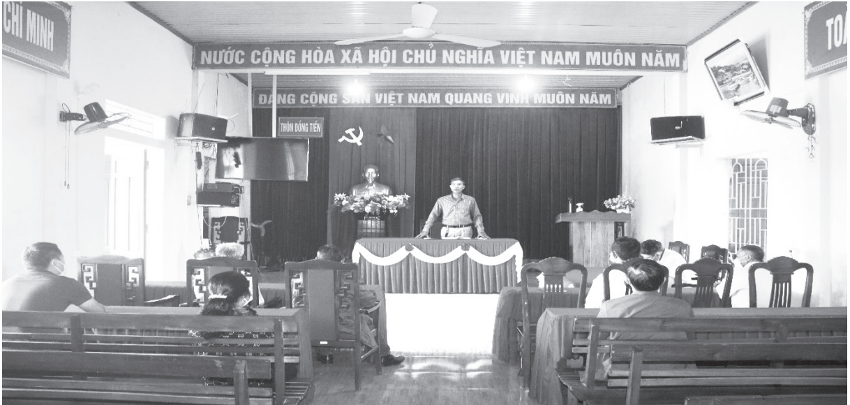
Khảo sát xây dựng tổ hoà giải cơ sở kiểu mẫu tại Tổ hoà giải thôn Đồng Tiến, xã Kỳ Đồng

T rong những năm qua, công tác phổ biến, giáo dục pháp luật nói chung và công tác hòa giải ở cơ sở nói riêng luôn được các cấp ủy Đảng, chính quyền trên địa bàn huyện Kỳ Anh đặc biệt quan tâm lãnh đạo, chỉ đạo triển khai.