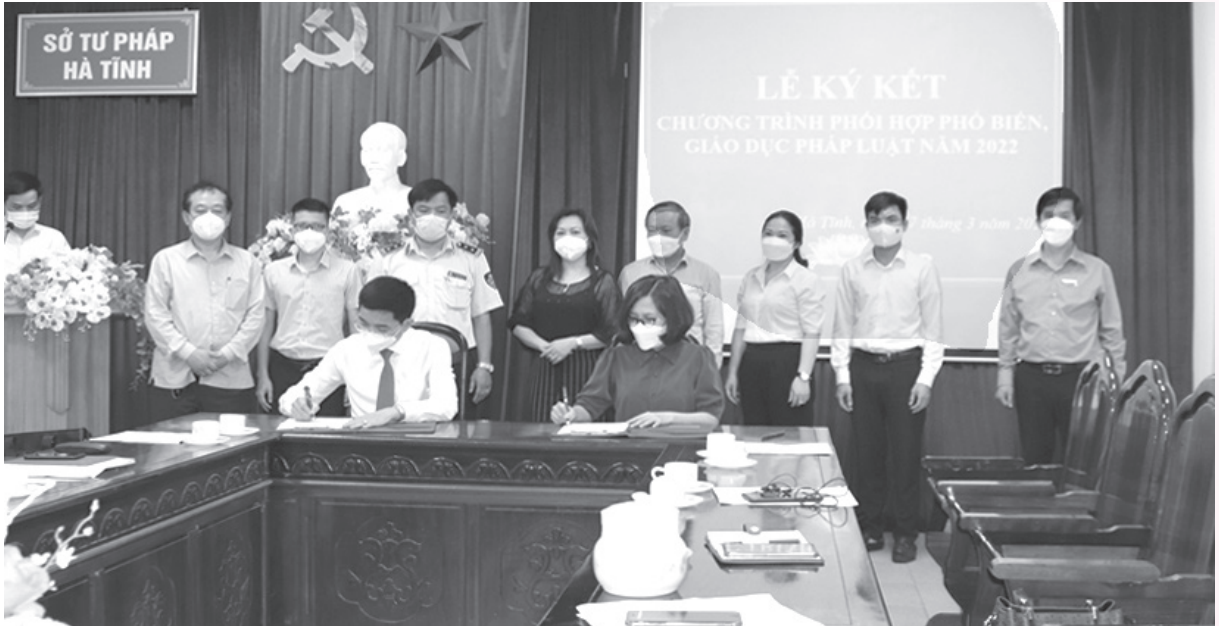
Sở Tư pháp tổ chức Lễ ký kết chương trình PBGDPL năm 2022 với các đơn vị

Năm 2021 thực hiện Nghị quyết Đại hội đại biểu Đảng bộ tỉnh Hà Tĩnh lần thứ XIX và Nghị quyết Đại hội đại biểu toàn quốc lần thứ XIII của Đảng, đồng thời là năm diễn ra cuộc bầu cử đại biểu Quốc hội và đại biểu Hội đồng nhân dân các cấp nhiệm kỳ 2021-2026. Do đó, các hoạt động phổ biến giáo dục pháp luật được đẩy mạnh, triển khai rộng khắp ở các cấp, các ngành, các cơ quan, đơn vị, địa phương. Theo số liệu thống kê, toàn tỉnh đã tổ chức 3.212 cuộc phổ biến pháp luật trực tiếp với hơn 346 ngàn lượt người tham dự; phát hành trên 617 ngàn tài liệu tuyên truyền pháp luật.