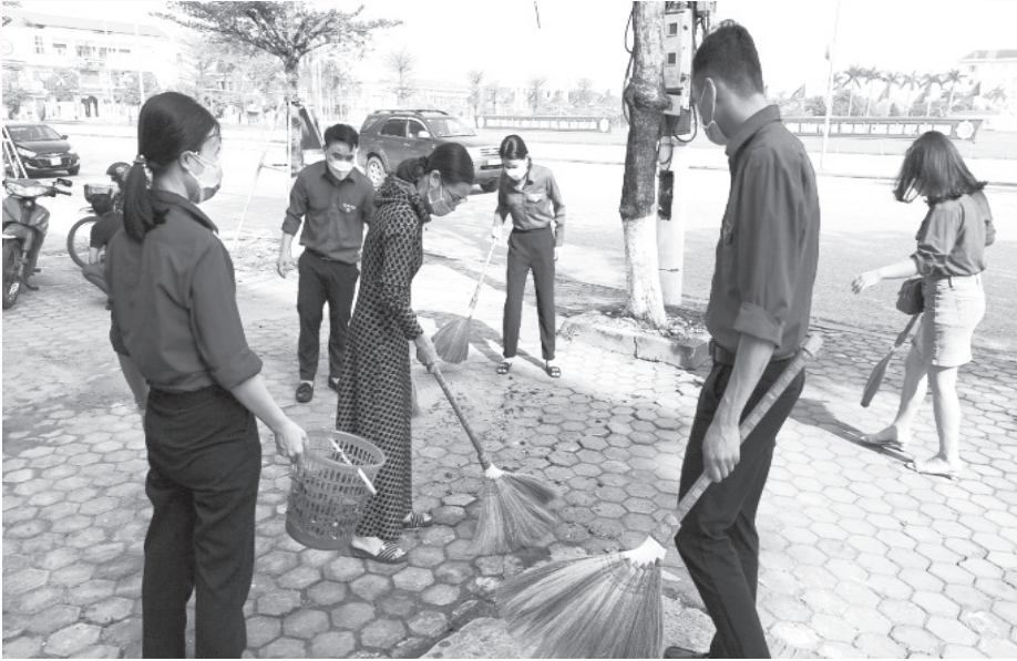
Đoàn viên tham gia tổng dọn vệ sinh hưởng ứng ngày chủ nhật xanh

trình số hóa Sổ hộ tịch giai đoạn 3, đảm bảo tính chính xác, đầy đủ thông tin theo nội dung Sổ hộ tịch giấy còn lưu giữ được.