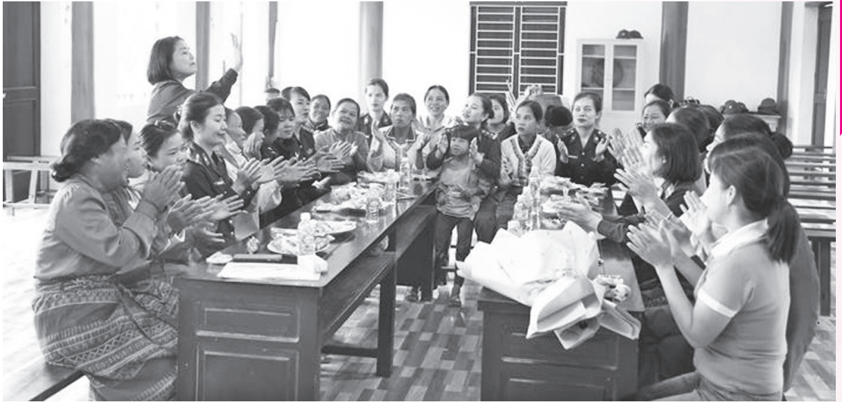
Chị em hội viên phụ nữ bản Rào Tre tham dự buổi tuyên truyền chống hôn nhân cận huyết thống