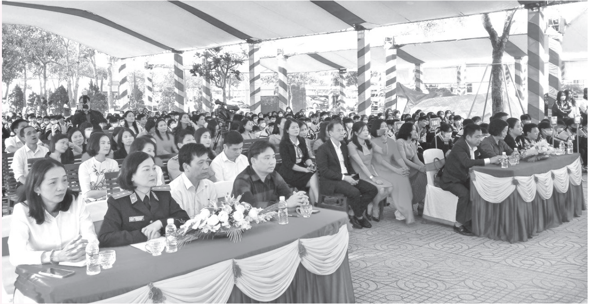
Toàn cảnh phiên tòa giả định tại trường THPT Nguyễn Thị Minh Khai

Hà Tĩnh lần thứ XIX và Nghị quyết Đại hội đại biểu Đảng bộ huyện Đức Thọ lần thứ XXX; chỉ đạo các đơn vị trên địa bàn toàn huyện hưởng ứng Ngày Pháp luật, theo đó đã phối hợp tổ chức 28 cuộc tập huấn tuyên truyền các văn bản luật thu hút hơn 4.000 đối tượng tham gia. Phối hợp với khoa Luật học - Trường Khoa học Xã hội và nhân văn - Trường Đại học Vinh tổ chức phiên tòa giả định tuyên truyền, phổ biến, giáo dục pháp luật về phòng chống ma túy cho gần 2.000 học sinh trường THPT Trần Phú và trường THPT Minh Khai. Thường xuyên đăng tải các thông tin pháp luật mới trên cổng thông tin điện tử huyện, trên mạng xã hội facebook với tài khoản “Tư pháp Đức Thọ” để cán bộ, công chức và Nhân dân thuận tiện trong việc nghiên cứu, tìm hiểu. Trong đợt phát động này viết 8 tin đăng trên trang thông tin của Sở. Trên địa bàn huyện đã in ấn 2.650 tờ rơi, tờ gấp; treo sơn 95 băng rôn, khẩu hiệu tại trụ sở cơ quan, ủy ban và các trục đường chính trên địa bàn huyện.