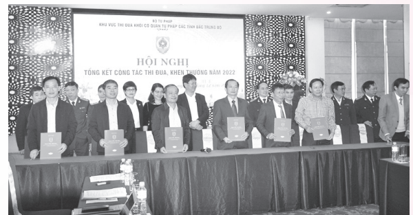
Các đơn vị trong khu vực ký kết giao ước thi đua năm 2023