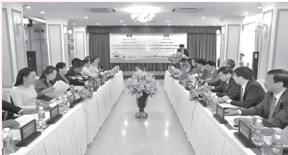
Ngày 23/11/2022, Sở Tư pháp tỉnh Hà Tĩnh tổ chức Hội đàm với Sở Tư pháp tỉnh Bolikhămxay, nước CHDCND Lào

Tại Hội đàm, các Sở Tư pháp đã đánh giá kết quả thực hiện Biên bản hợp tác về pháp luật và tư pháp giai đoạn 2017 - 2022; trao đổi, chia sẻ về đặc điểm, tình hình, những cách làm hay, hiệu quả trong việc triển khai công tác tư pháp, thi hành án giữa các Sở. Lãnh đạo Sở Tư pháp các tỉnh đã trao quà lưu niệm nhằm thắt chặt thêm tình hữu nghị giữa các Sở.