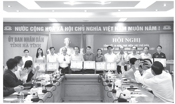
Các tập thể, cá nhân có thành tích xuất sắc trong 10 năm thực hiện Luật PBGDPL và 10 năm hưởng ứng Ngày Pháp luật Việt Nam