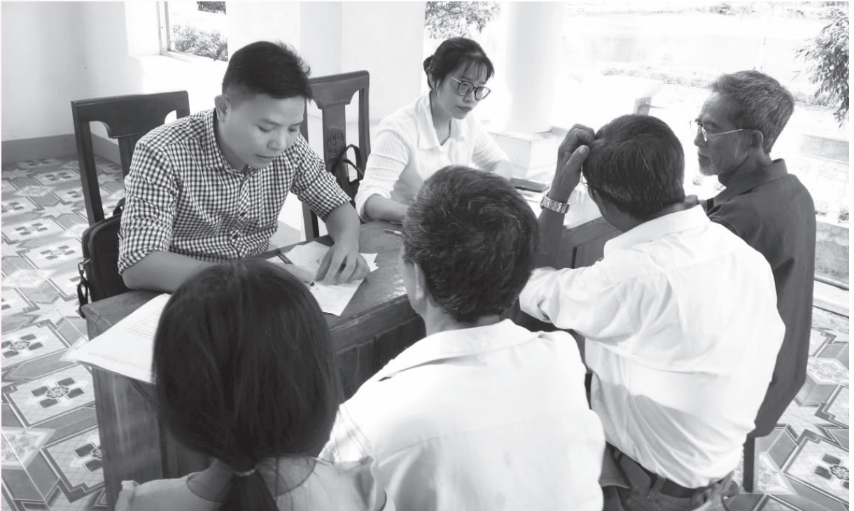
Trợ giúp viên pháp lý tư vấn, hướng dẫn pháp luật tại xã Kỳ Trung, huyện Kỳ Anh