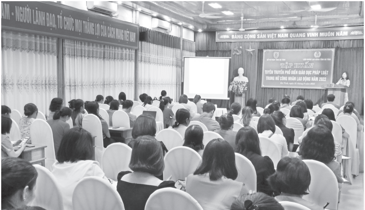
Liên đoàn lao động tỉnh phối hợp Sở TP Hà Tĩnh tuyên truyền chính sách lao động nữ cho cán bộ nu công và trưởng ban nữ công công đoàn cơ sở trong doanh nghiệp