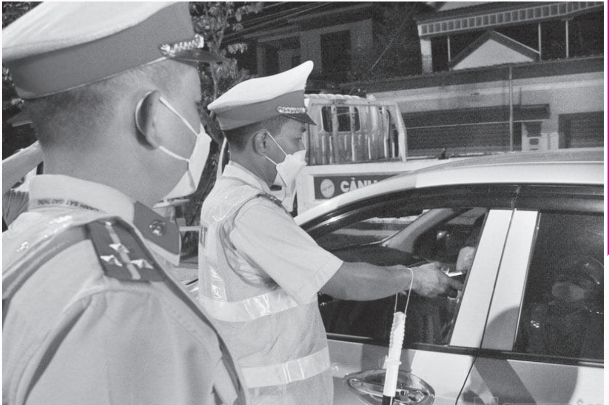
Công an Hà Tĩnh xử lý nghiêm lái xe vi phạm nồng độ cồn

bổ sung thêm hành vi vi phạm hành chính về “hóa đơn” để tính thời hiệu xử phạt vi phạm hành chính 02 năm.