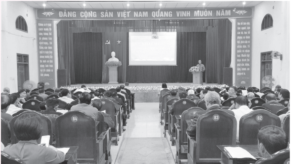
Hội nghị tập huấn công tác mặt trận