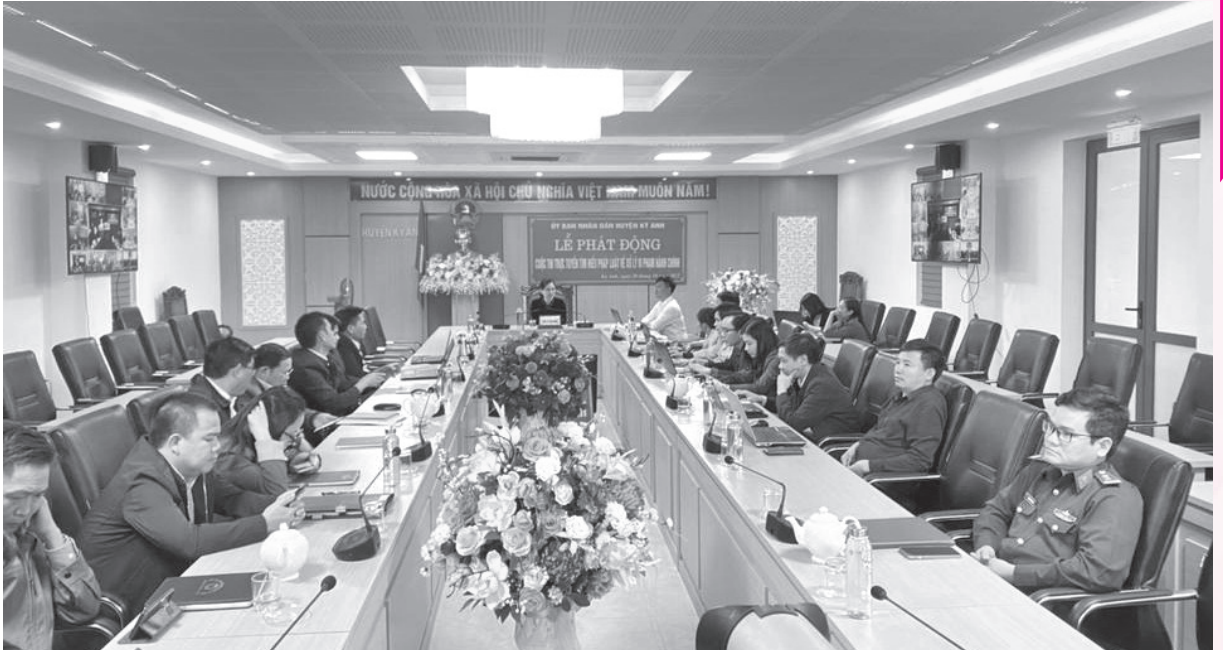
UBND huyện Kỳ Anh phát động cuộc thi cấp huyện

Cuộc thi trực tuyến “Tìm hiểu pháp luật về xử lý vi phạm hành chính” do Sở Tư pháp chủ trì, phối hợp với các cơ quan, đơn vị có liên quan tổ chức đã diễn ra từ ngày 20/10/2022 đến ngày 05/11/2022. Cuộc thi là sân chơi lành mạnh, bổ ích nhằm tăng cường hơn nữa công tác tuyên truyền, nâng cao hiểu biết, ý thức chấp hành pháp luật về xử lý vi phạm hành chính cho cán bộ, đảng viên và mọi tầng lớp Nhân dân. Đồng thời là hoạt động hưởng ứng Ngày pháp luật nước Cộng hòa xã hội chủ nghĩa Việt Nam (09/11).