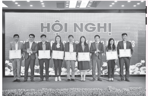
Các tập thể, cá nhân nhận Bằng khen của Bộ Trưởng Bộ Tư pháp, UBND tỉnh và Giấy khen của Giám đốc Sở

Năm 2023, ngành Tư pháp Hà Tĩnh tiếp tục tham mưu về công tác thể chế và giải quyết các vấn đề pháp lý của địa phương; nâng cao chất lượng công tác xây dựng, hoàn thiện hệ thống pháp luật và tăng cường hiệu quả thi hành pháp luật; tăng cường công tác theo dõi tình hình thi hành pháp luật; triển khai hiệu quả Luật sửa đổi, bổ sung một số điều của Luật Xử lý vi phạm hành chính, Luật Ban hành văn bản QPPL, Luật Hòa giải cơ sở, Luật Trợ giúp pháp lý và các văn bản hướng dẫn; tăng cường quản lý Nhà nước trong lĩnh vực hỗ trợ tư pháp, hộ tịch, quốc tịch, chứng thực, bồi thường Nhà nước; sắp xếp, kiện toàn tổ chức bộ máy cơ quan tư pháp các cấp; đa dạng các hình thức PBGDPL; tăng cường ứng dụng công nghệ thông tin trong công tác PBGDPL, gắn với việc thực hiện chuyển đổi số; tiếp tục triển khai hiệu quả các Đề án tuyên truyền, PBGDPL trên địa bàn tỉnh ..../.