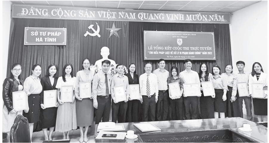
Cá cá nhân huyện Kỳ Anh nhận giải tại cuộc thi

Nhờ làm tốt công tác chỉ đạo và truyền thông về cuộc thi, trên địa bàn huyện Kỳ Anh đã thu hút đông đảo cán bộ, đảng viên và mọi tầng lớp Nhân dân tham gia cuộc thi. Kết thúc cuộc thi toàn huyện đã có 4.533 người đăng ký dự thi, với hơn 10.000 lượt người tham gia thi. Nhiều đơn vị có số