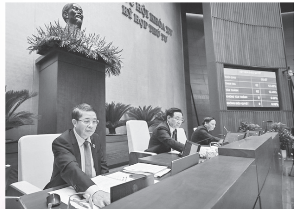
Các đại biểu Quốc hội biểu quyết thông qua Luật Thực hiện dân chủ ở cơ sở

Luật Thực hiện dân chủ ở cơ sở được Quốc hội thông qua ngày 10/11/2022, có hiệu lực thi hành kể từ ngày 01/7/2023. Một trong các điểm đáng chú ý của Luật này là so với quy định tại Pháp lệnh thực hiện dân chủ ở xã, phường, thị trấn thì Luật này đã bổ sung thêm một số vấn đề do Nhân dân bàn và quyết định.