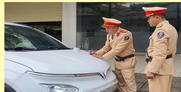
Công an thành phố Hà Tĩnh kiểm tra, xử lý đối với hành vi dừng, đỗ phương tiện không đúng quy định

3. Người điều khiển phương tiện tham gia giao thông đường bộ khi dừng xe, đỗ xe trên đường phải thực hiện các quy định sau đây: